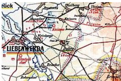
Dobra auf einer geschichtlichen Karte des Kreises Liebenwerda

Dobra verdankt seinen Namen dem sorbischen dobra voda , was „gutes Wasser“ heißt und möglicherweise vom ursprünglichen Bachnamen abgeleitet wurde.