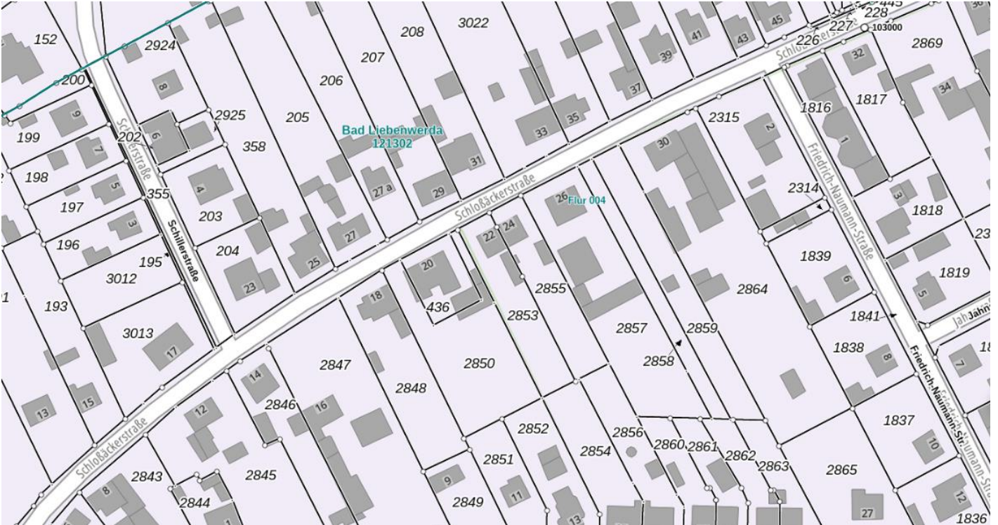
Auszug aus dem Brandenburgviewer

Wir präsentieren Ihnen ein opulentes, ortsüblich erschlossenes Grundstück in bester Lage in der Kurstadt Bad Liebenwerda. Die Schloßackerstraße besticht durch ihre zentrale Lage und die gute Infrastruktur. Einkäufe und Wege des täglichen Lebens können zu Fuß oder mit dem Fahrrad erledigt werden. Auch die örtlichen Schulen sind gut Erreichbar, ebenso die Freizeiteinrichtungen.