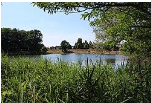
Neben dem Badesee ist der Festplatz mit Freilichtbühne

Der Ort wurde 1384 urkundlich erstmals als Frankinhayn erwähnt. Weitere Erwähnungen und Schreibweisen waren: 1384 Frankenhain , 1474 und 1602 Franckenhain . Der Ortsname bezeichnet eine am Hain gelegene Siedlung der Franken beziehungsweise des Franko .