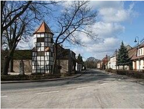
Die Dorfstraße in Frankenhain

Frankenhain ist ein Ortsteil der Stadt Schlieben im Landkreis Elbe-Elster in Brandenburg. Frankenhain liegt etwa 3 Kilometer südöstlich des Stadtkerngebietes.