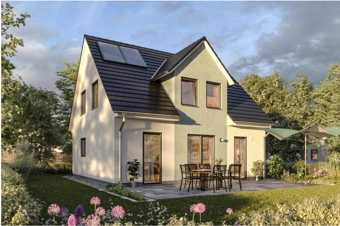
Gartenansicht Flair 113

Dieses herrliche Areal ist gerade zu prädestiniert, um das wunderschöne Hauskonzept Flair 113 zu errichten. Dieses Hauskonzept ist für diejenigen gedacht, die gerne selbst Hand anlegen und ihr Zuhause eigenständig bauen bzw. ausbauen möchten. Anders als bei anderen schlüsselfertigen Massivhäusern der Fa. Town & Country, ist dieses Objekt ausbaufähig. Man kann hier durch handwerkliches Geschick bei Sanitäranlagen, beim Fliesen verlegen und dem Einbau der Innentüren bares Geld sparen.