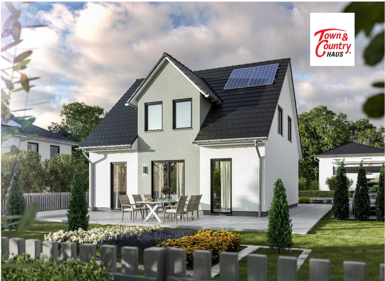
Gartensicht Flair 113

Dieses herrliche Areal ist geradezu prädestiniert, um das wunderschöne Hauskonzept Flair 113 zu errichten. Dieses Hauskonzept ist für diejenigen gedacht, die gerne selbst Hand anlegen und ihr Zuhause eigenständig bauen bzw. ausbauen möchten. Anders als bei anderen schlüsselfertigen Massivhäusern der Fa. Town & Country, ist dieses Objekt ausbaufähig. Man kann hier durch handwerkliches Geschick bei Sanitäreanlagen, beim Fliesen verlegen und dem Einbau der Innentüren bares Geld sparen.